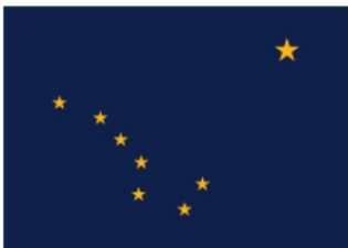
Vlajka státu Aljaška